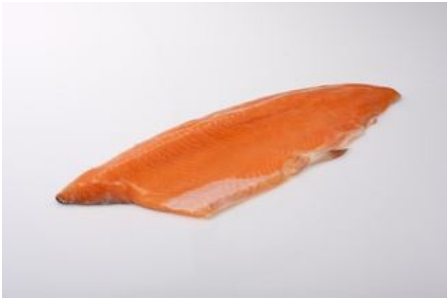
Mynd: Íslensk bleikja frá Samherja