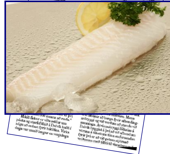
Úr Morgunblaðinu 14. apríl 2009. Þorskhakki frá Samherja